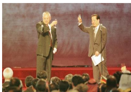
1997 年香港回歸典禮上，時任特首 董建華 及國家副總理兼外交部長 錢其琛 舉杯祝賀。

1997 年 7 月 1 日凌晨，時任國家主席 江澤民 宣佈 中華人民共和國香港特別行政區 成立。隨後 香港特別行政區 的行政長官、主要官員、行政會議成員、終審法院和高等法院法官等人員宣誓就職。