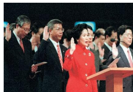
政務司長 陳方安生 帶領首屆特區政府主要官員宣誓就任。

1997 年 7 月 1 日凌晨，時任國家主席 江澤民 宣佈 中華人民共和國香港特別行政區 成立。隨後 香港特別行政區 的行政長官、主要官員、行政會議成員、終審法院和高等法院法官等人員宣誓就職。