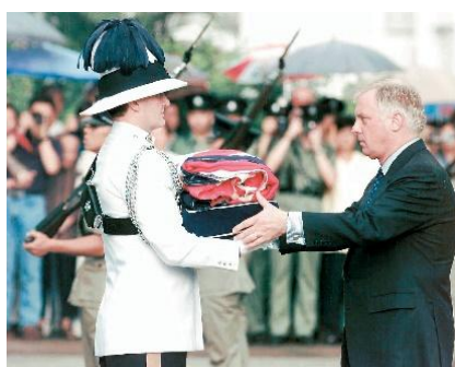
最後一任港督 彭定康 接過曾懸掛在港督府的 英國國旗 。