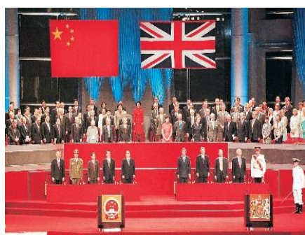
香港主權交接儀式在 1997 年 6 月 30 日深夜 11 時 30 分正式舉行。這標誌著中國正式恢復對香港的管治。