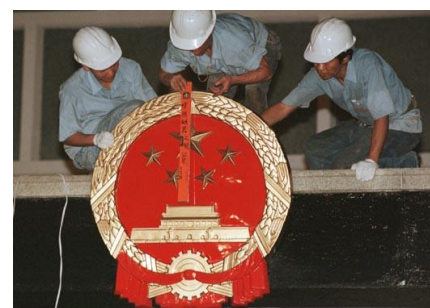
香港的政府大樓換上 中華人民共和國 國徽。