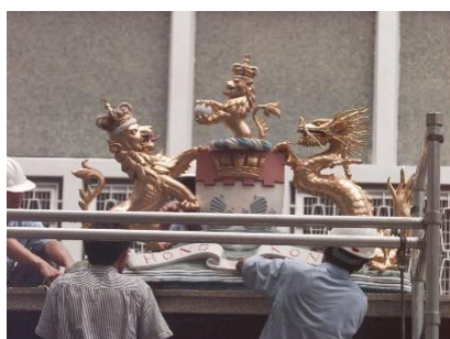
代表 英國殖民地 的皇冠標誌被拆下來。