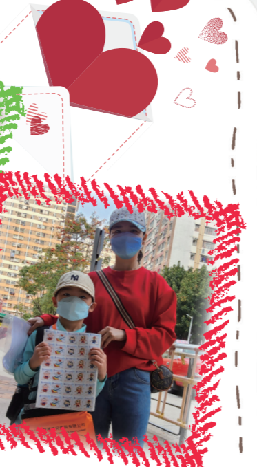
與媽媽一起賣旗，幫助有需要的小朋友，真有意義。