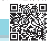
使用電子產品的正確姿勢