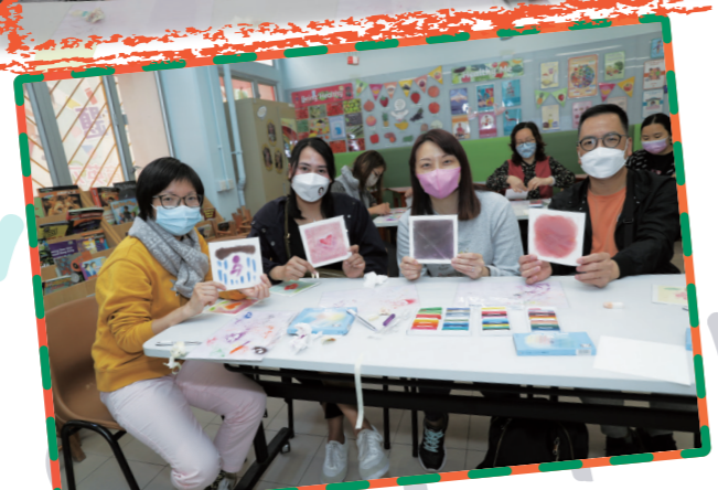
我們的創作，美麗嗎？