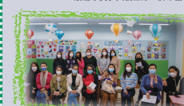
我們樂於參與學校各項活動及服務